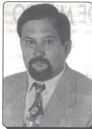
Ervando Gonçalves de Oliveira Presidente